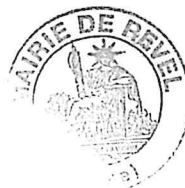
Coralie Bourdelain Maire de Revel